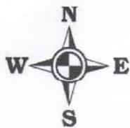
Схема границ прилегающих территорий, на которых не допускается розничная продажа алкогольной продукции -стоматологический кабинет по адресу: п. Коноша, пр. Октябрьский д.21