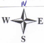
Схема границ прилегающих территорий, на которых не допускается розничная продажа алкогольной продукции -медицинский кабинет адрес: п. Коноша ул.Советская, 33