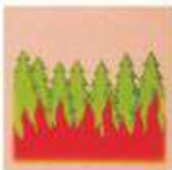
ОСТАВЛЕННЫЙ В ЛЕСУ НЕПОГАШЕННЫЙ КОСТЕР