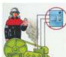
ЗАПРЕЩАЕТСЯ ЭКСПЛУАТИРОВАТЬ НЕИСПРАВНЫЕ ЭЛЕКТРОУСТАНОВКИ