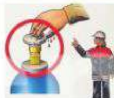
СЛЕДИТЕ, ЧТОБЫ НА БАЛЛОН С КИСЛОРОДОМ НЕ ПОПАЛО МАСЛО ИЛИ ЖИР