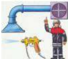
ОКРАСочные РАБОТЫ ВЕДИТЕ ТОЛЬКО ПРИ ВКЛЮЧЕННОМ ВЕНТИЛЯТОРЕ