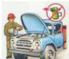
ОТОГРЕВАТЬ ДВИГАТЕЛЬ ТОЛЬКО ГОРЯЧЕЙ ВОДОЙ