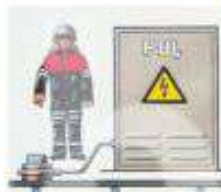
СЛЕДИТЕ ЗА ИСПРАВНОСТЬЮ ЗАЩИТНОГО ЗАЗЕМЛЕНИЯ