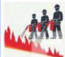
ПРИ ВОЗНИКНОВЕНИИ ПОЖАРА: 1. СООБЩИТЬ О ПОЖАРЕ ПО ТЕЛЕФОНУ 2. ИСПОЛЬЗОВАТЬ ПЕРВИЧНЫЕ СРЕДСТВА ПОЖАРОТУШЕНИЯ 3. ЭВАКУИРОВАТЬ ЛЮДЕЙ 4. ВСТРЕТИТЬ ПОЖАРНОЕ ПОДРАЗДЕЛЕНИЕ