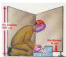
ОГРАЖДАЙТЕ МЕСТО СВАРКИ МЕТАЛЛИЧЕСКИМИ ЩИТАМИ