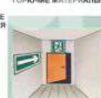
НЕ ЗАГРОМОЖДАЙТЕ ПУТЬ ЭВАКУАЦИИ