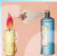
РАСПЫЛЕНИЕ АЭРОЗОЛЕЙ В БЛИЗИ ОТКРЫТОГО ОГНЯ