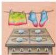
ОСТАВЛЕННАЯ БЕЗ ПРИСМОТРА ГАЗОВАЯ ПЛИТА