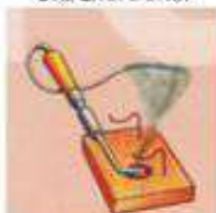
ОТСУТВИЕ НЕСГОРАЕМОЙ ПОДСТАВКИ