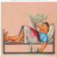
КУРЕНИЕ В ПОСТЕЛИ