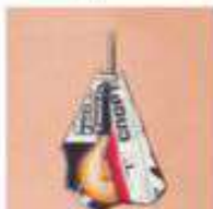
ОБЕРНУТАЯ БУМАГОЙ ЛАМПА