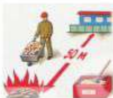
ЗАПРЕЩАЕТСЯ СЖИГАТЬ ОТХОДЫ БЛИЖЕ, ЧЕМ НА 50 М ОТ ЗДАНИЯ И СООРУЖЕНИЙ