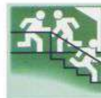
ПРИ ЭВАКУАЦИИ НЕ ДОПУСКАЙТЕ ПАНИКИ