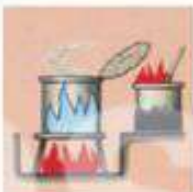
РАЗОГРЕВАНИЕ НА ОТКРЫТОМ ОГНЕ ДАЖА ИЛИ КРАСКИ