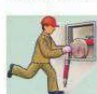
ОБЕСПЕЧЬТЕ БЕСПРЯТСТВЕННЫЙ ДОСТУП К СРЕДСТВАМ ПОЖАРОТУШЕНИЯ