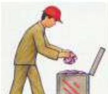
ПРОМАСЛЕННУЮ ВЕЩЬ СКЛАДЫВАЙТЕ В СПЕЦИАЛЬНЫЙ МЕТАЛЛИЧЕСКИЙ КОНТЕЙНЕР