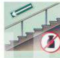
НЕ ХРАНИТЕ ПОД ЛЕСТНИЦЕЙ ГОРЮЧИЕ МАТЕРИАЛЫ