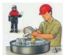
НЕ ПРИМЕНЯЙТЕ ДЛЯ МОЙКИ ДЕТАЛЕЙ И СТИРКИ СПЕЦОДЕЖДЫ ЛЕГКОВОСПЛАМЕНЯЮЩИЕСЯ ЖИДКОСТИ