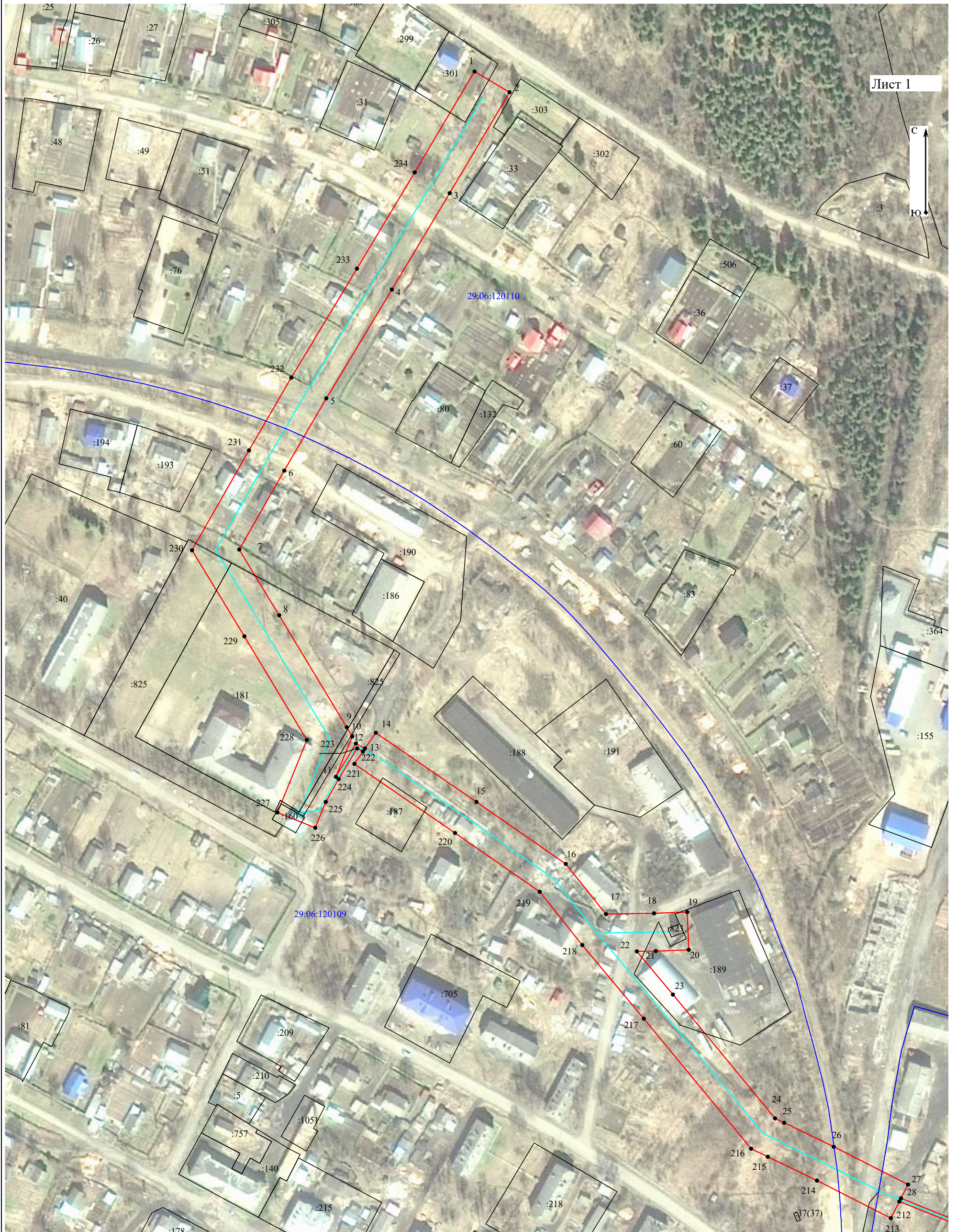
Схема расположения границ публичного сервитута объекта электросетевого хозяйства: «ВЛ-10 кв "Поселок" от п/ст Коноша от оп.5», расположенного по адресу: Архангельская область, Коношский район